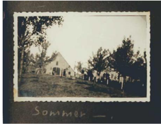
Sommer — boerderij in de zomer