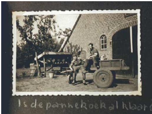
Is de pannekoek al klaar?