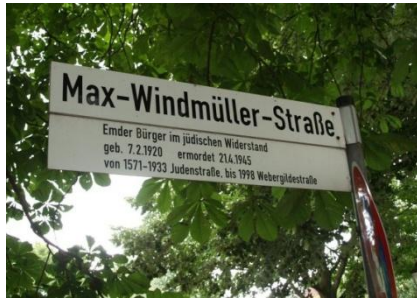
Max Windmüller Strasse in Emden