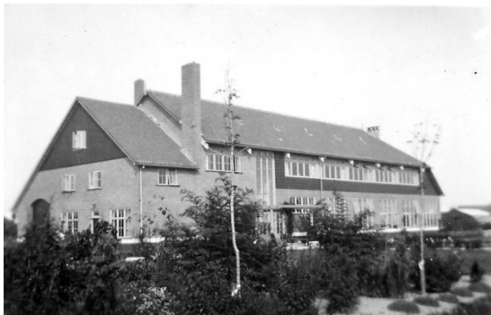
werkdorp de Wieringermeer

In 1934 was onder andere in de Wieringermeer, nabij het dorp Nieuwesluis, een agrarisch opleidingscentrum opgericht om Duitse vluchtelingen tussen de 18 en 24 jaar op te vangen. Officieel heette het: Werkdorp der Stichting Joodse Arbeid. Het dorp kreeg de status van hachsjara-instelling, waarmee de leerlingen de mogelijkheid kregen na hun opleiding naar Palestina te emigreren. Het Werkdorp werd in 1941 op last van de bezetter gesloten. Een deel van de bewoners is tijdens een grote razzia in Amsterdam opgepakt en naar Mauthausen gedeporteerd. Andere oud-werkdorpers hebben deelgenomen aan de verzetsactiviteiten van de zogenaamde Westerweelgroep.