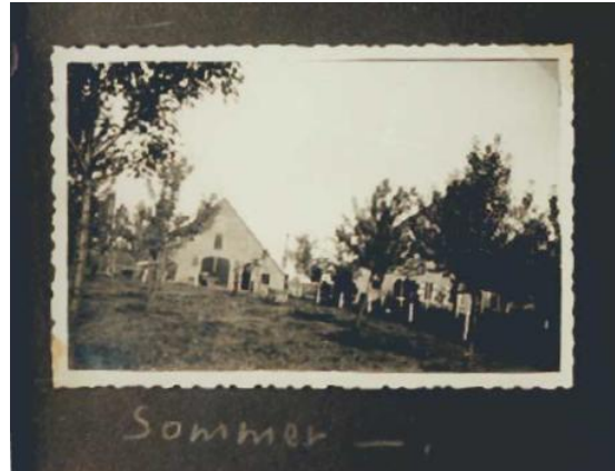
Sommer boerderij in de zomer