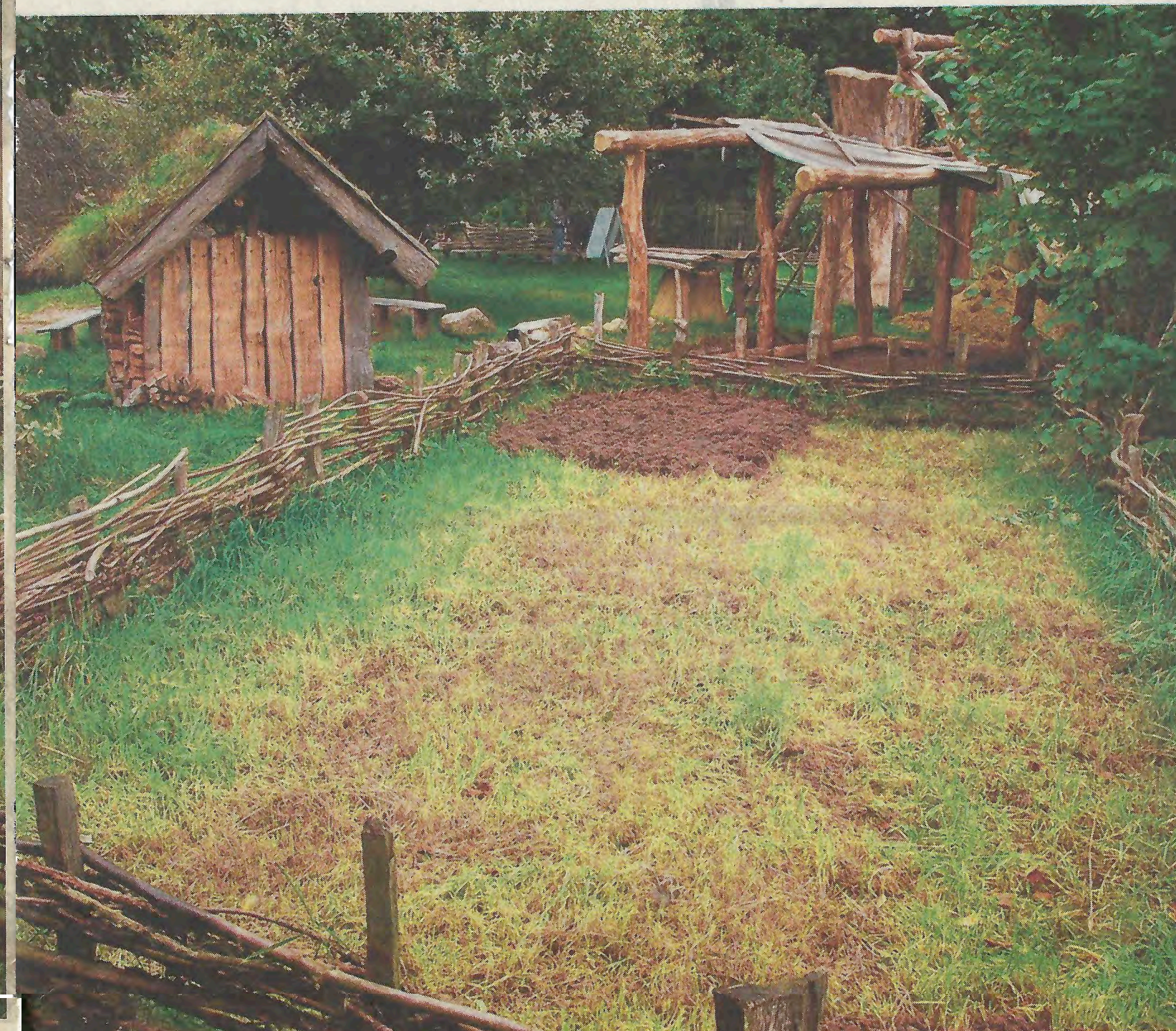
Historische akker op de Bronzezeithof in Uelsen. Het toont de periode van de late prehistorie.

zaaid. Een deel van de oogst werd in de wintermaanden zorgvuldig bewaard als zaaigoed voor het volgende seizoen. Op verschillende plekken zijn bij opgravingen potten en grondsporen van speciale graanschuren, zogenoemde spiekers, voor de opslag van granen gevonden. Opmerkelijk is dat er vondsten van katten zijn gedaan, een bewijs dat al heel lang geleden katten werden gebruikt bij de bestrijding van muizen. Bij de bewerking van de grond werden runderen en geen paarden gebruikt. Koeien leverden niet alleen melk, vlees, leer en mest, maar trokken ook de eerste ploegen. En ossen sjoeden karren met grote houten wielen voort. In de oude geulen van de Dinkvallei ontstonden hoogvenen en