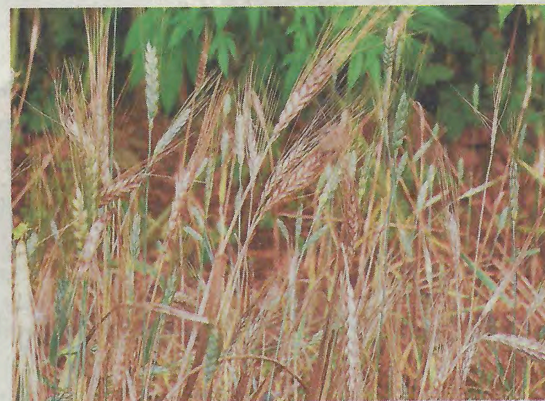
Emmertarwe behoort tot de traditionele graangewassen die in de late prehistorie op ontgonnen bosgrond werd verbouwd.

Informatie: bronzezeithof.de Tevens is een rondwandeling noordelijk van het kuuorord in Bad Bentheim door een historisch landschap.